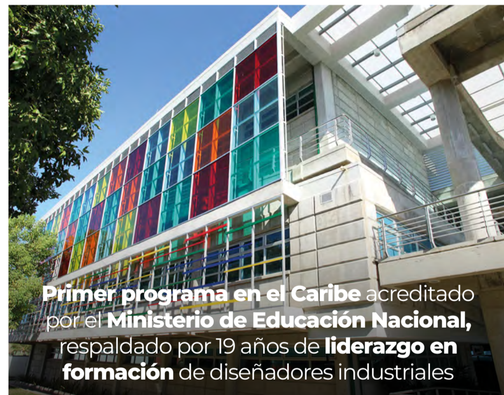
Primer programa en el Caribe acreditado por el Ministerio de Educación Nacional , respaldado por 19 años de liderazgo en formación de diseñadores industriales