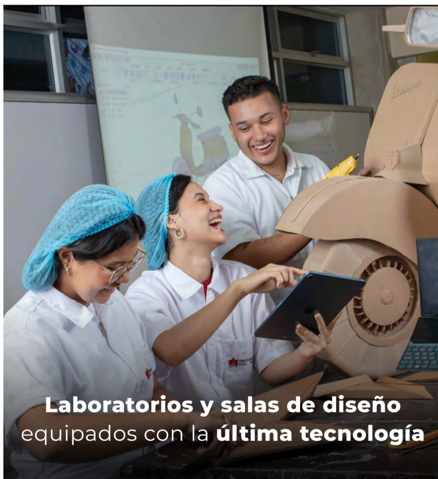
Laboratorios y salas de diseño equipados con la última tecnología