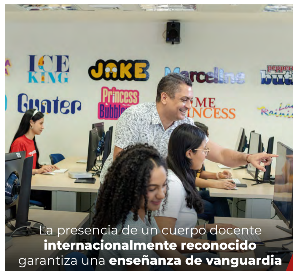
La presencia de un cuerpo docente internacionalmente reconocido garantiza una enseñanza de vanguardia