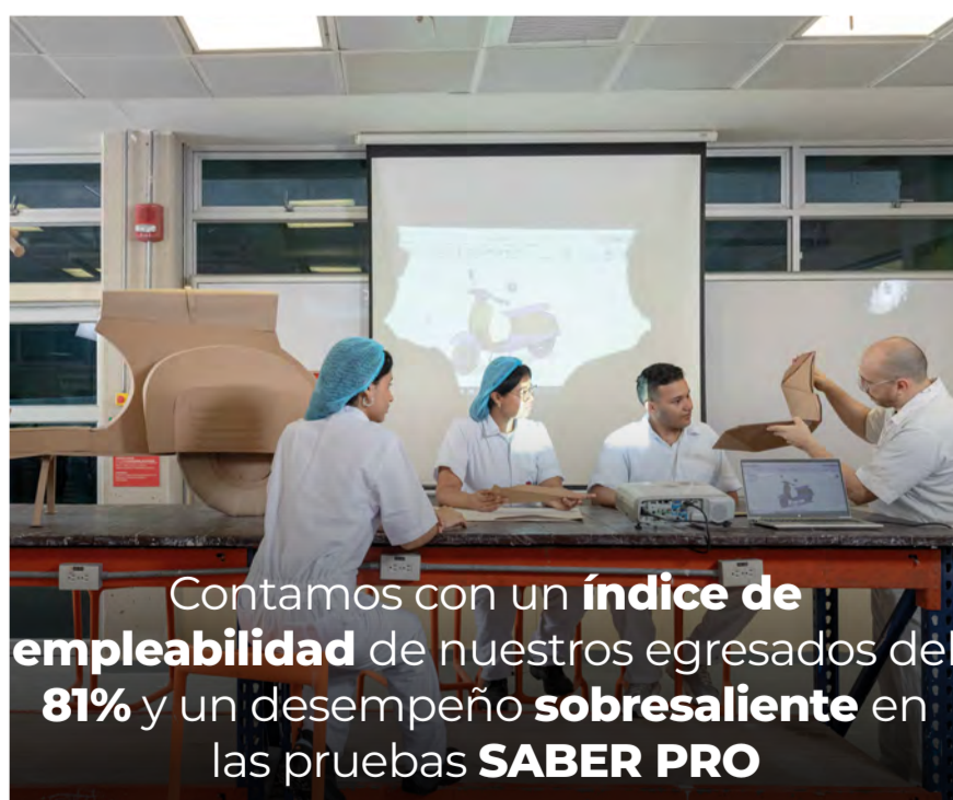
Contamos con un índice de empleabilidad de nuestros egresados del 81% y un desempeño sobresaliente en las pruebas SABER PRO