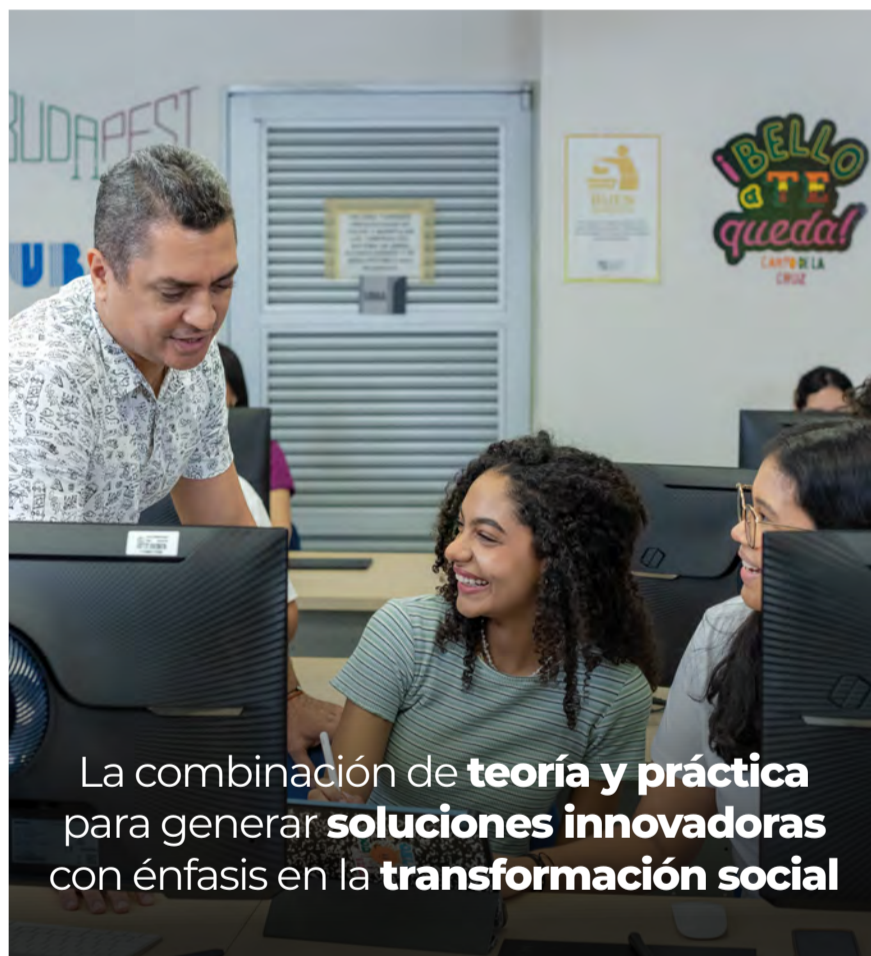
La combinación de teoría y práctica para generar soluciones innovadoras con énfasis en la transformación social